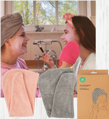
Microvezel Handdoek - 10.99€