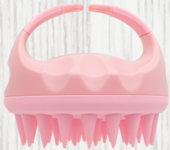
Hoofdhuid massage borstel - 7.99€

Deze borstel aan 7.99€ doet je shampoo schuimen en zorgt voor een diepe reiniging. De siliconen noppen scrubben je hoofdhuid zachtjes, waardoor de doorbloeding van de hoofdhuid wordt gestimuleerd en een optimale haargroei wordt bevorderd.