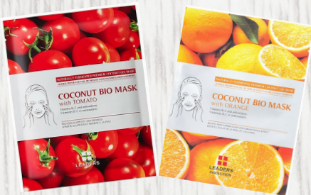
Bio-cellulosemasker met tomaat - 4.95€ Bio-cellulosemasker met sinaasappel - 4.95€

Geef jouw huid een boost voor het nieuwe schooljaar Bio-cellulose maskers hebben 350x fijnere vezels dan andere maskers! Door deze fijnheid kan het masker zich in de poriën nestelen om ze diep te hydrateren. De vezels trekken het vocht beter aan en houden het vast. Het gezichtsmasker past zich beter aan op de huid, waardoor je verschillende activiteiten kan uitoefenen terwijl je het draagt! Een must try!