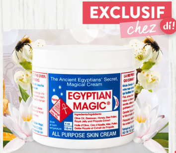
Egyptian magic crème 59ml – 27€

- SLEEP badschuim (8.99€) en kussenspray (5.99€): met natuurlijke essentiële oliën van lavendel en kamille, perfect voor een rustgevende nachtrust.