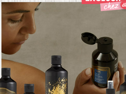
Energy doucheegel - 8.99€ Energy lichaamsscrub - 9.99€ Calm badschuim - 8.99€ Calm lichaamssolie - 5.99€ Sleep badschuim - 8.99€ Sleep kussenspray - 5.99€