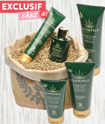
Biologische Lichaamsbalsem 150ml 21,19€, Biologische lippenbalsem 15ml 6,49€, Biologische handcrème 50ml 7,99€, Biologische voetcrème 100ml 14,89€, Biologische gezichtscrème 40ml 17,99€, Biologisch hydraterend serum 30 ml 20,29€